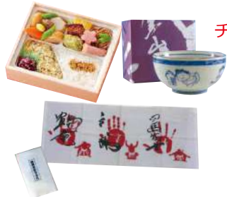
※画像はイメージとなりますので実際とは異なる場合があります